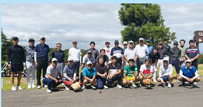
第7回DRP ネットワーク石川地区親睦ゴルフコンペ 2023年9月9日