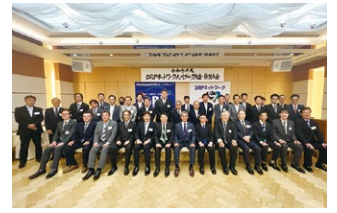
第13回 DRP ネットワーク 九州ブロック大会 in 佐賀 2023年10月13日