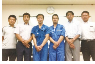
2023年度 第3回北陸ブロック地区部長会議 2023年8月2日