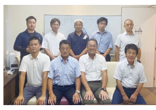
2023年度 第3回宮城地区会議 2023年8月25日