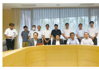
2023年度 第3回九州ブロック地区部長会議 2023年8月26日