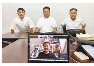
2023年度 第3回中国ブロック地区部長会議 2023年9月2日