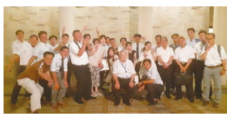
2023年度 東海ブロック感謝の夕べ 2023年7月7日