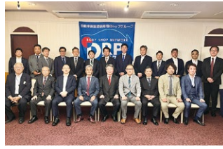
2023年度 第4回全国ブロック長会議 2 2023年10月21日