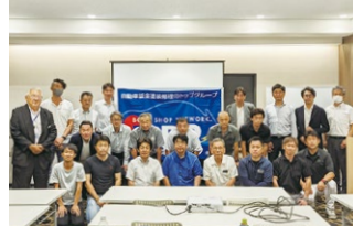
2023年度 第1回東北ブロック研修会1 2023年8月4日