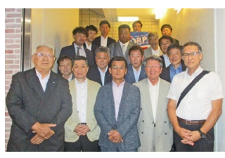
2023年度 第3回全国ブロック長会議 2023年7月8日