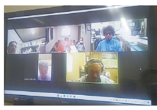
2023年度 第3回大阪地区会議 2023年8月9日