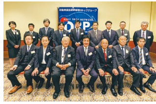
2023年度 第3回北海道ブロック会議 2023年10月6日