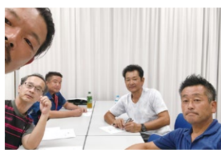
2023年度 第3回岐阜地区会議 2023年8月18日