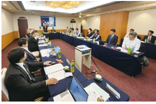
2023年度 第4回全国ブロック長会議 1 2023年10月21日