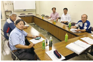
2023年度 第3回大分地区会議 2023年9月13日