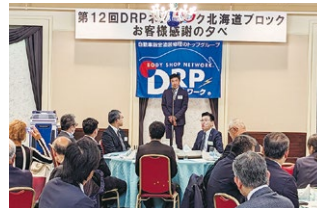
第12回北海道ブロックお客様 感謝の夕べ 2023年10月6日