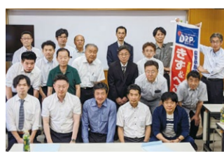
2023年度 第2回北海道ブロック会議 2023年7月22日