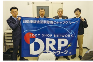
2023年度 青森地区会議 2023年10月21日