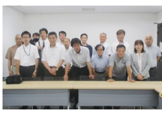
2023年度 第3回神奈川地区会議 2023年8月4日