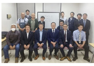
2023年度 第2回宮城地区会議 2023年5月19日