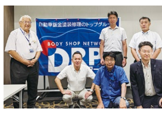
2023年度 第3回東北ブロック地区部長会議 2023年8月4日