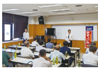
2023年度 北海道ブロック勉強会 2023年7月22日