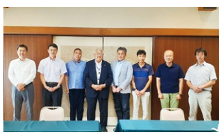
2023年度 第3回首都圏甲信越ブロック地区部長会議 2023年8月2日