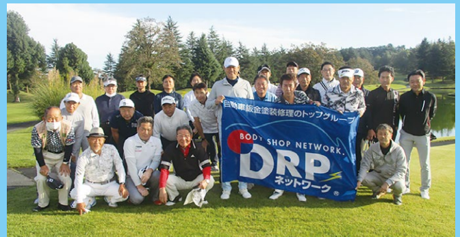
2023年度 DRP ネットワーク親睦ゴルフコンペ 2023年10月11日