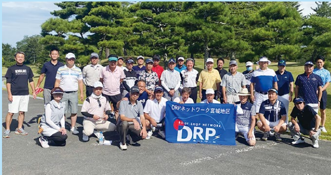
2023年度 宮城代協・DRPネットワーク宮城地区懇親ゴルフコンペ 2023年9月2日