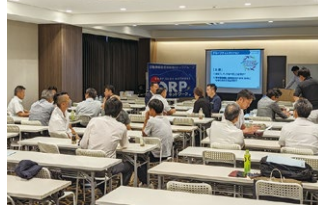
2023年度 第1回東北ブロック研修会2 2023年8月4日